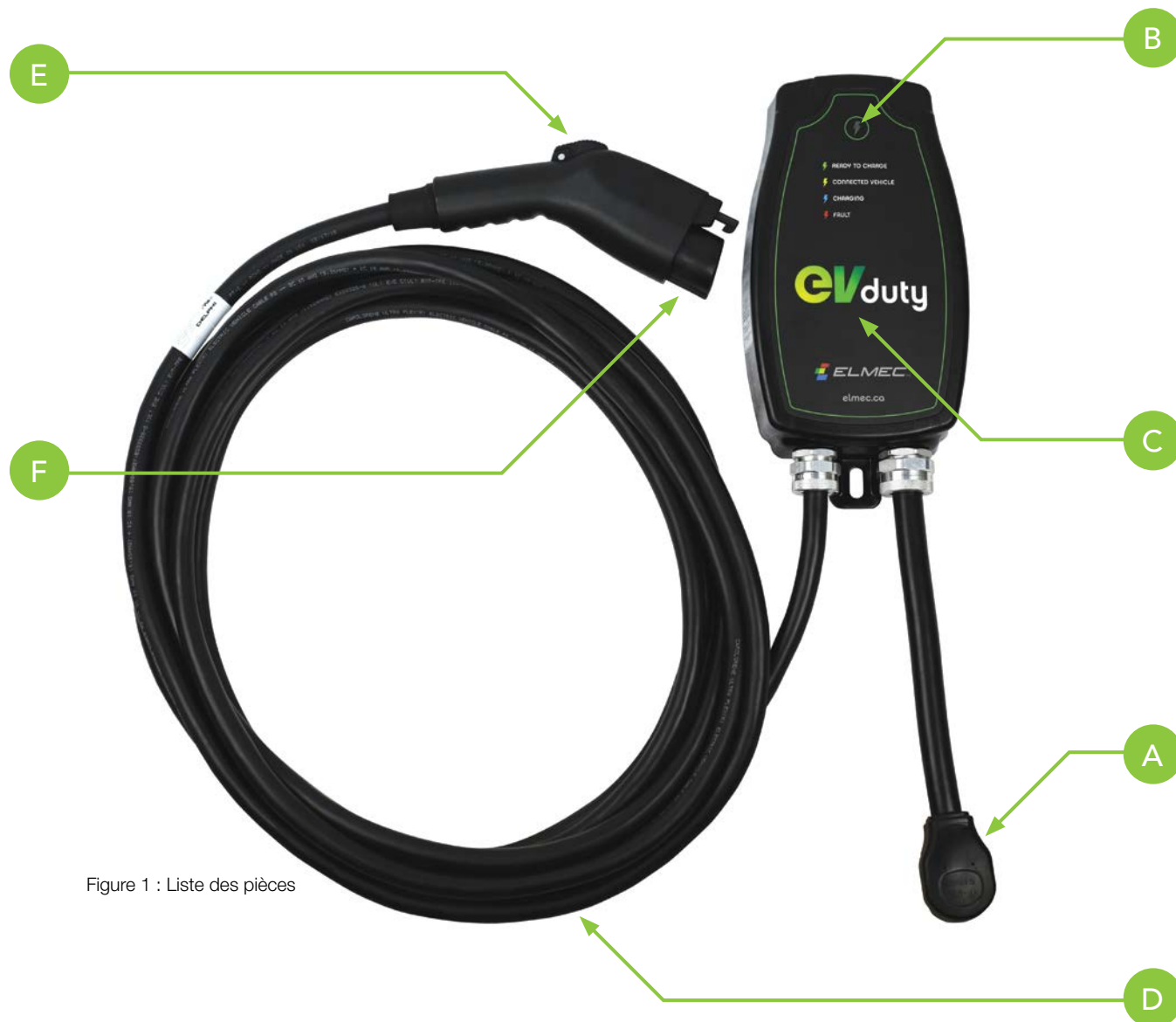
Figure 1 : Liste des pièces

Voici une description des pièces principales de cet équipement :